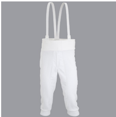
4 Hlače - Breeches