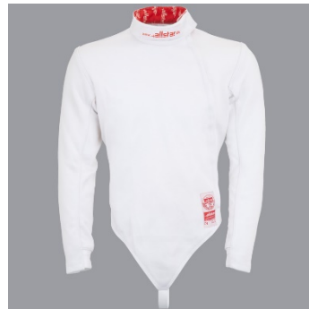
5 Jakna - Jacket