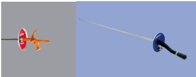
10 Floret - Foil