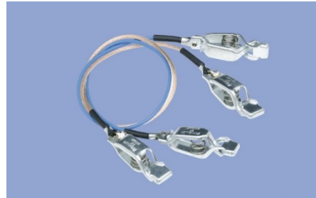
2 Kabel za masku – Cable for mask