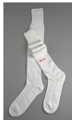
7 Čarape - Socks