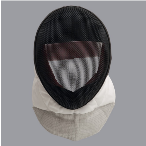
1 Maska - Mask