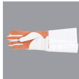
3 Rukavica - Glove