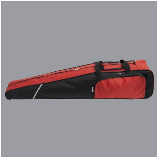
11 Torba za opremu - Carry Bag