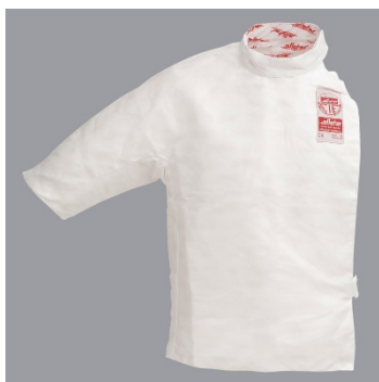
6 Zaštitni prsluk - Under plastron