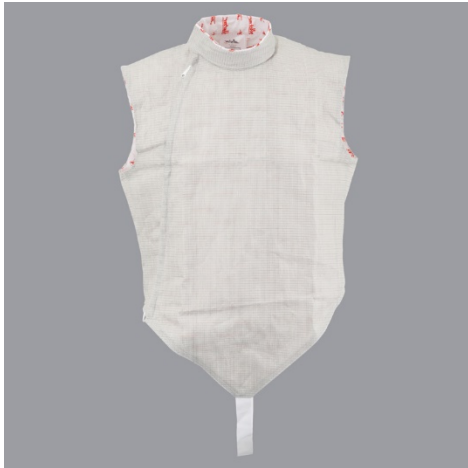
8 Metalni prsluk - Electric jacket