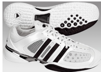
12 Obuča za mačevanje - Fencing Shoes